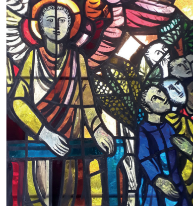
Aus unserem Kirchenfenster – Foto: Frank Bolz