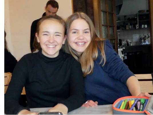
Mit Spaß dabei!